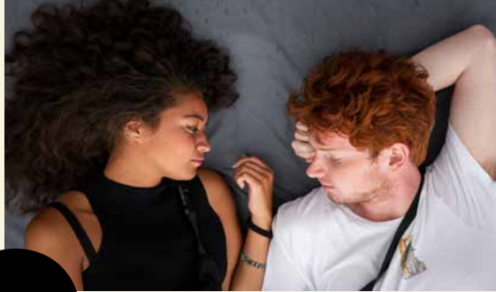
LOWLANDS 2019 door Sarah Mei Herman