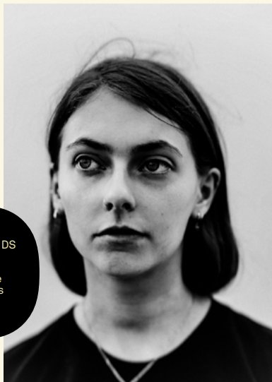
LOWLANDS 2019 door Jitske Schols

De Portrait Gallery heeft een nomadisch karakter: we zijn statutair gevestigd in Amsterdam en we produceren hiervandaan onze projecten. Omdat we echter geen eigen tentoonstellingsruimte hebben, realiseren we onze tentoonstelling op verschillende plaatsen. Dit nomadische element is een sterk onderscheidende eigenschap die de Portrait Gallery tot een flexibele organisatie maakt met beperkte risico's. Ons nomadische bestaan blijft dan ook de lijn voor de komende vier jaar. Daarbij zien wij het als een stimulans dat de commissie van het Amsterdams Fonds voor de Kunst die onze aanvraag voor een Tweejarige subsidie positief beoordeelde, ons