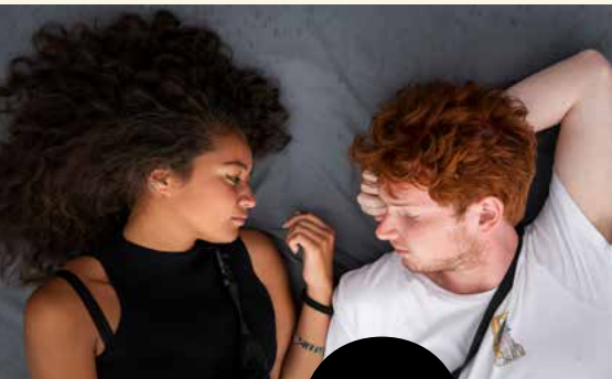
LOWLANDS 2019 door Sarah Mei Herman

Wij werken samen met instituten, musea en kunstenaars die onze doelstellingen onderschrijven en die het belang van deze toegankelijkheid van kunst en innovatie met ons delen. Zo streeft partner Het Scheepvaartmuseum een open cultuur na