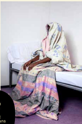
SOLD 2018 door Ernst Coppejans