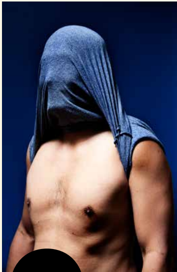
SOLD 2019 door Ernst Coppejans

In december 2019 was onze pop-uptentoonstelling SOLD van de Amsterdamse fotograaf Ernst Coppejans te zien in Museum Jan Cunen tijdens The Lifeline / Serious Request actie van 3FM en het Rode Kruis, om aandacht te vragen voor het groeiende aantal slachtoffers van mensenhandel in Nederland. SOLD bestaat uit geanonimiseerde portretten van mensenhandelslachtoffers die Coppejans fotografeerde in verschillende opvangcentra. Hun persoonlijke verhalen zijn een belangrijk onderdeel van het project.