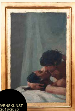
LEVENSKUNST 2019/2020 door Aat Veldhoen

Met de tentoonstelling Levenskunst – Aat Veldhoen ontvingen we de meeste persaandacht uit ons bestaan. Zowel Het Parool , de Volkskrant , NRC als de Telegraaf besteedden er ruime aandacht aan in specials en artikelen. Rondom de opening was er een aan Levenskunst gewijd nieuwsitem op Radio 1, en op 31 januari 2020 was het AVRO TROS tv-programma Nu Te Zien gewijd aan deze tentoonstelling.