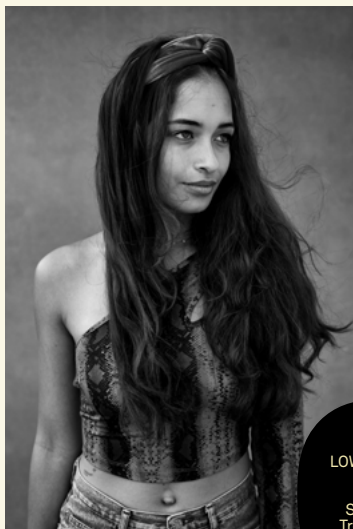
LOWLANDS 2019

schermen op het festivalterrein en op zondag werd een selectie van de portretten opgenomen in de populaire festivalkrant Daily Paradise.