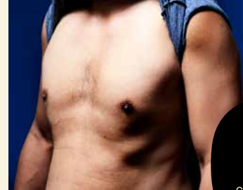
SOLD Skull 2018 door Ernst Coppejans