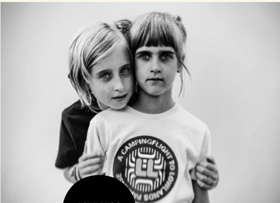
LOWLANDS 2019 door Jitske Schols