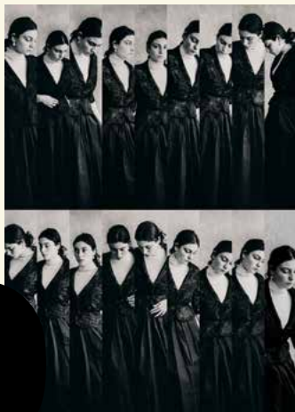
FOR ANNA 2019