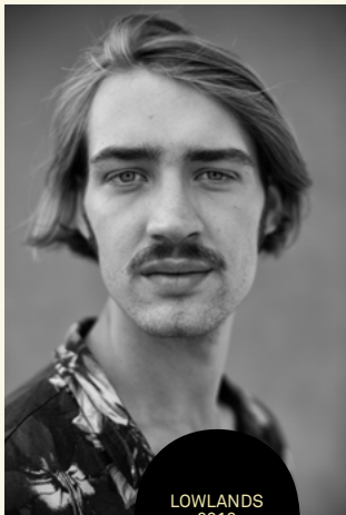
LOWLANDS 2019 door Sander Troelstra

In de eerste jaren van ons bestaan investeerden de zzp'ers in de organisatie door naast hun betaalde uren ook een aantal uren onbezoldigd te werken. Het bestuur is eind 2018 met de ingehuurde zzp'ers een uurtarief van 35 euro overeengekomen. Dit tarief houdt rekening met de beschikbare budgetten (haalbaarheid) voor de verschillende projecten en met wat het bestuur op dat