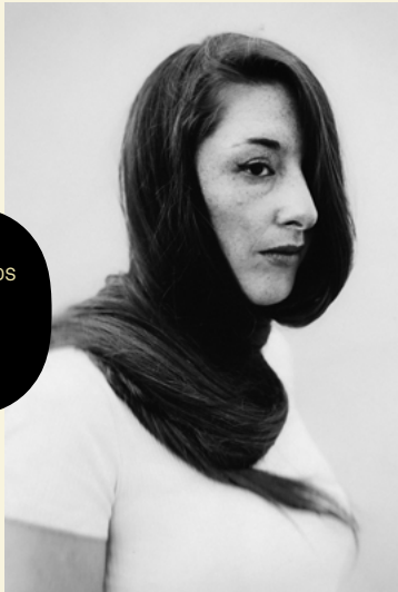
LOWLANDS 2019 door Jitske Schols