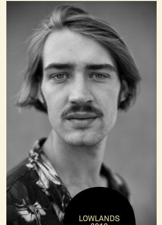
LOWLANDS 2019